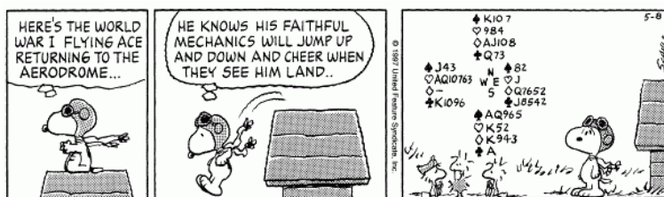
Copyright © 1997 United Feature Syndicate, Inc. Redistribution in whole or in part prohibited

Vergeet niet om u op te geven voor het 18e Herfsttoernooi op zondag 18 november aanstaande. Naast de leuke prijzen, waaronder een bridgeweekend in Hotel Asteria, is er een leuke loterij met prijzen die door de middenstand van Winterswijk ter beschikking worden gesteld. Het toernooi wordt afgesloten met een buffet en vindt plaats in onze speellocatie Partycentrum Nijenhuis.